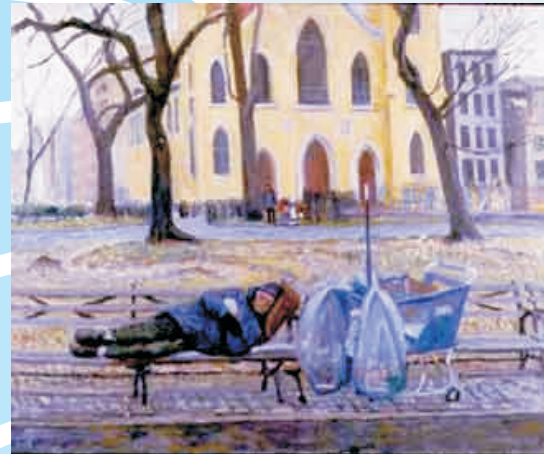
Homeless. Georg Grosz.

Zure esperientzia, irakurketak eta ikusitako filmak kontuan hartuta, eman zirkulu bakoitzeko gertaera edo adibide baten berri.