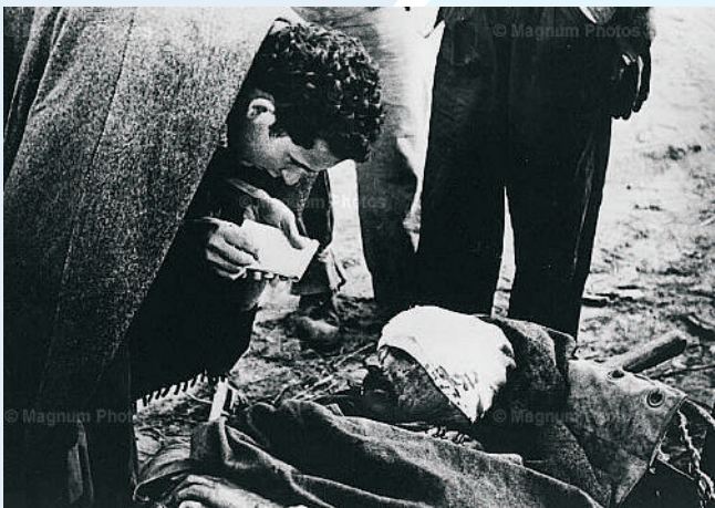
Spanish Civil War. Robert Capa. (1936-39)