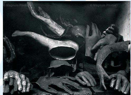
Henri Cartier-Bresson. Frantzia, 1929.