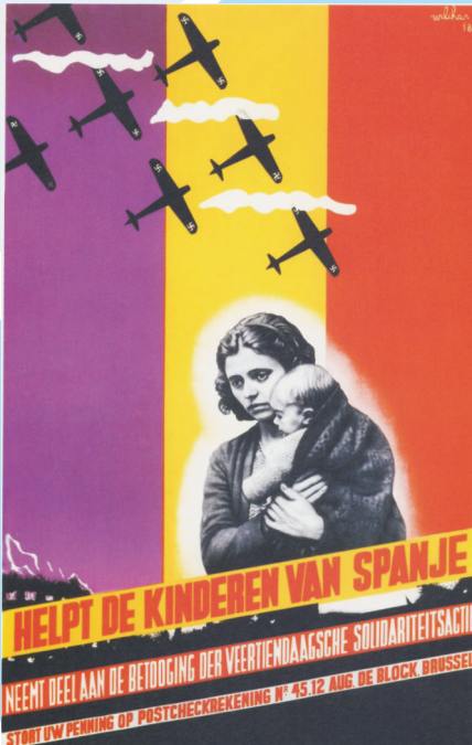
Litografia. Lagundu Espainiako haurrei. 1938. Institut d'Histoire Sociale, Gante

Zure esperientzia, irakurketak eta ikusitako filmak kontuan hartuta, eman zirkulu bakoitzeko gertaera edo adibide baten berri.